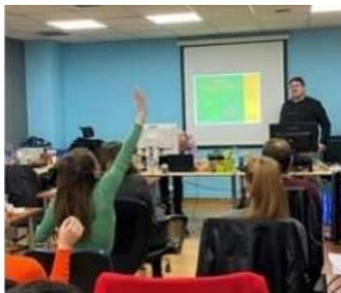
Eveniment de multiplicare în Dublin

Printre participanți s-au numărat adulți defavorizați, formatori de adulți, asistenți sociali și alți profesioniști din organizații din domeniul educației adulților.