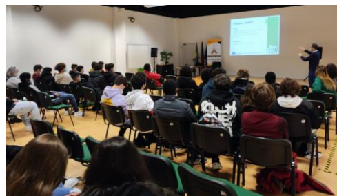
Sessão final na Amadora

Nas audiências estiveram presentes adultos desfavorecidos, formadores, trabalhadores da área social e outros profissionais relacionados com a formação de adultos.