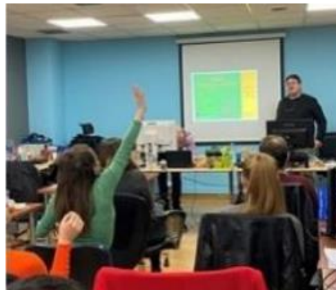
Wydarzenie w Dublinie

Wśród uczestników byli dorośli znajdujący się w trudnej sytuacji, edukatorzy dorosłych, pracownicy socjalni i inni specjaliści z organizacji zajmujących się edukacją dorosłych.