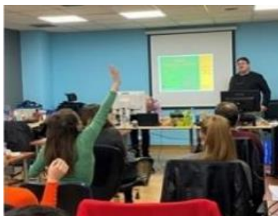
Multiplier event in Dublin

Entre los participantes había adultos desfavorecidos, educadores de adultos, trabajadores sociales y otros profesionales de organizaciones del ámbito de la educación de adultos.