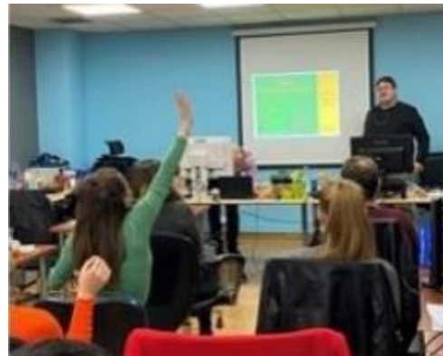
Εκδήλωση στο Δουβλίνο

Μεταξύ των συμμετεχόντων υπήρχαν ενήλικες από ευάλωτες κοινωνικές ομάδες, εκπαιδευτές/τριες ενηλίκων, κοινωνικοί λειτουργοί και άλλοι επαγγελματίες από οργανισμούς στον τομέα της εκπαίδευσης ενηλίκων.